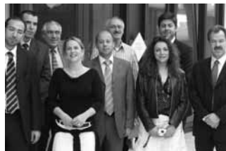
Delegation aus Zypern, Griechenland und Bulgarien (PAXIS-Projekt)