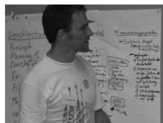
4. Existenzgründertag der Universität Stuttgart am 30.06.06